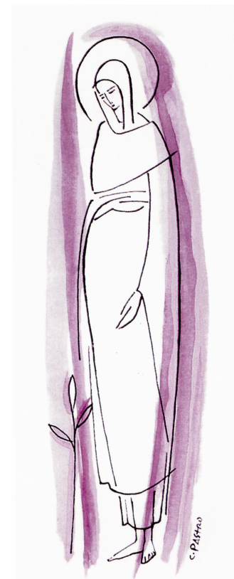
“Mãe de Deus grávida”: têmpera sobre cartão (1999).